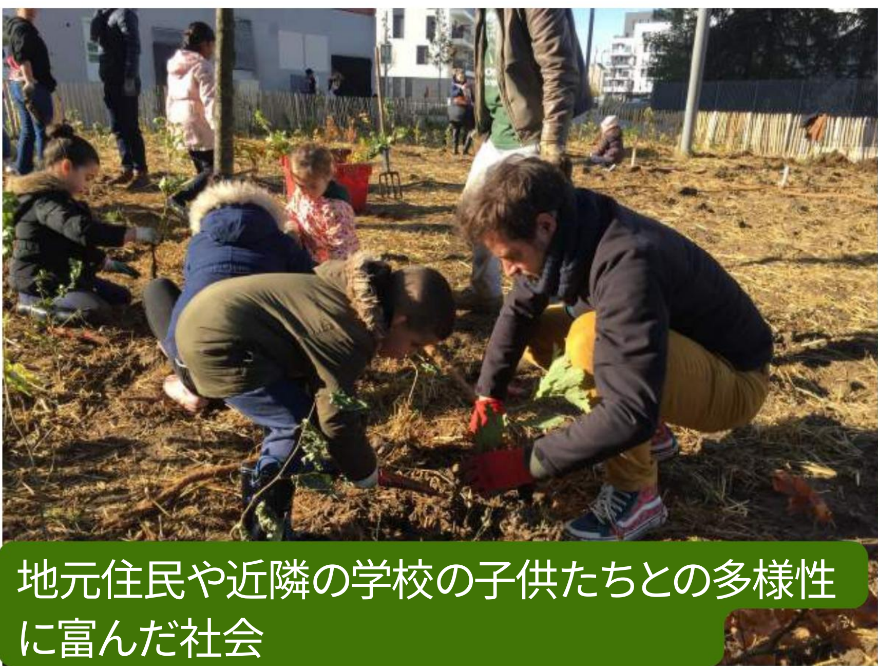
地元住民や近隣の学校の子供たちとの多様性に富んだ社会