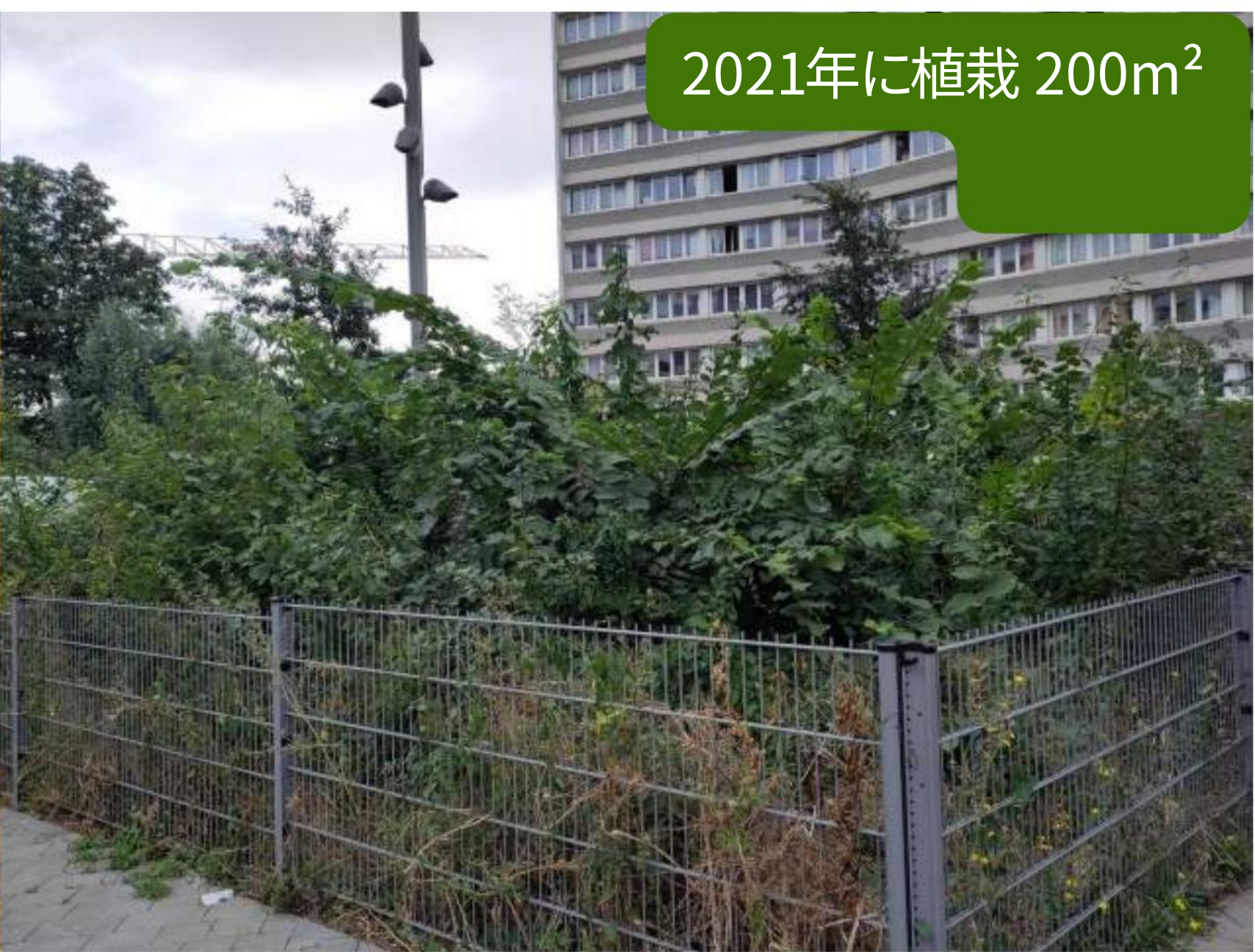
2021年に植栽 200m 2